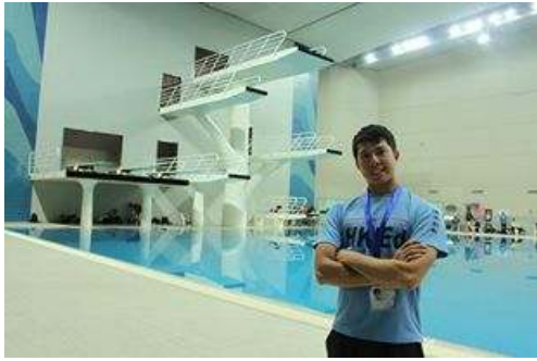
貝殼游泳館內跳水池