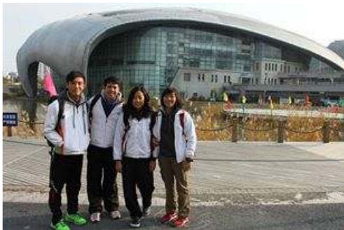
隊長團於貝殼游泳館

比賽日子來臨，於全國性的比賽上競技，對於一名運動員是一份榮幸。我們於 8X50 米蛙泳勇奪冠軍，比賽的過程十分刺激，在知道勝利後我們也十分雀躍。